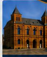
Basiliek van Constantijn