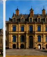
Groot Hertogelijk Paleis